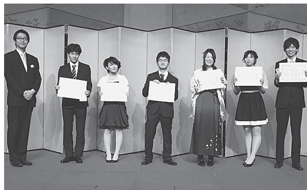
平成 26 年度優秀学生（左端は前理事長）

理学部学士課程の卒業生について、学業に優秀な成績を修めた者（各学科上位 3 名）を称え、るとともに在学生への学習意欲向上を図るために、優秀学生の表彰を執り行っております。成績優秀者の学生には副賞として 3 万円を授与しております。表彰は卒業記念祝賀会にて行っております。また学生の方々からメッセージをお預かりしており、HP にて公開しております。是非、一度ご確認ください。